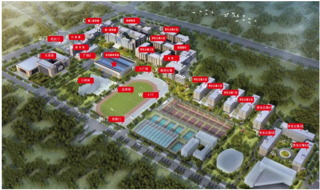
学院景观、建筑平面图